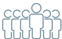
E町会 611 世帯

複数組織の導入では、合計した ID 数が該当する利用単価を適用できます。この例では、2,221ID が該当する @55 円 (税抜 @50 円) で計算します。なお、ID の発行は 10ID 単位となります。