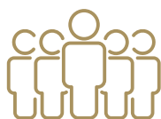
D町会 566 世帯